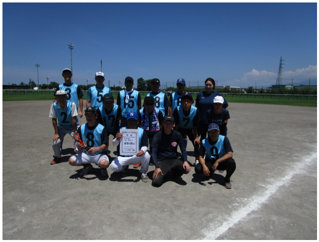
Aゾーン優勝 新庄校下 準優勝 堀川南校下