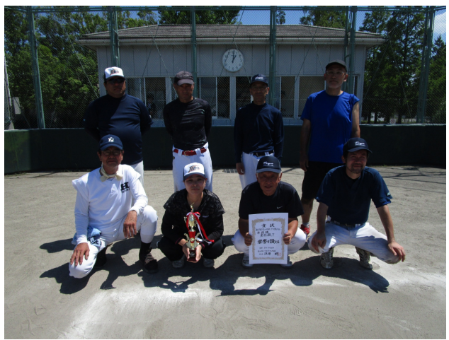
Bゾーン 優勝 堀川校下 準優勝 東部校下

7月30日曜日 富山市で開催 された富山市 ソフトボール 大会に、富山 市ソフトボール 協会が主催し た。この大会 は、富山市の ソフトボール の発展を目的 として、市内 の各中学校を 対象とした。 参加した学校 は、新庄校下 、堀川南校下 、堀川校下、 東部校下など の各校。大会 は、7月30日 に開催された。 この大会は、 富山市ソフト ボール協会の 主催による。