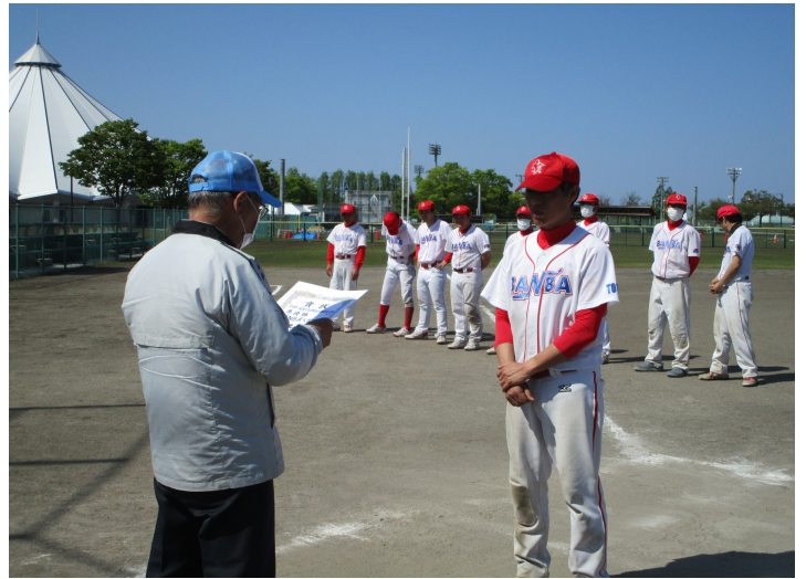
右 準優勝 BANBAペガサス