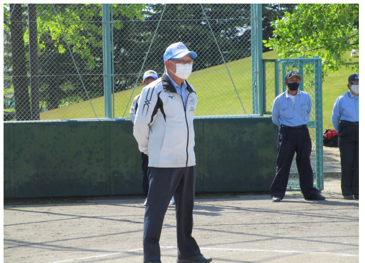
本日大会総評 浜井会長