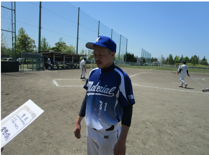
第3位 2チーム 左 アライドマテリアル 右 イワセ倶楽部