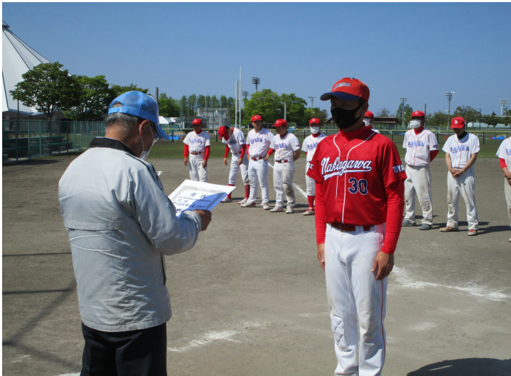
写真 左 優勝 中川自動車工業クラブ